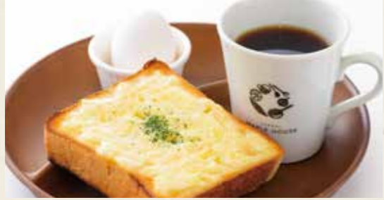
📍チーズトーストモーニング 618yen チーズトースト・ゆで卵・ドリンク (税込 680)