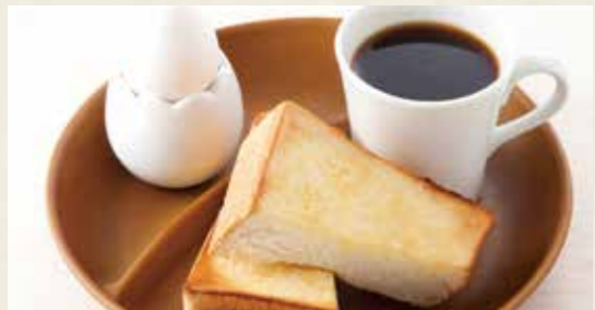
📍トーストモーニング 573yen 厚切りトースト・ゆで卵・ドリンク (税込 630)