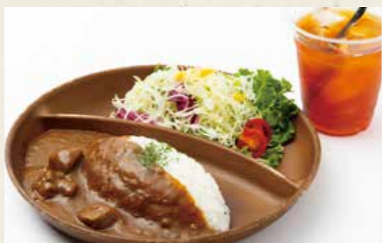
📍カレーランチ 900yen メープル特製ビーフカレー・サラダ・ドリンク (税込 990)