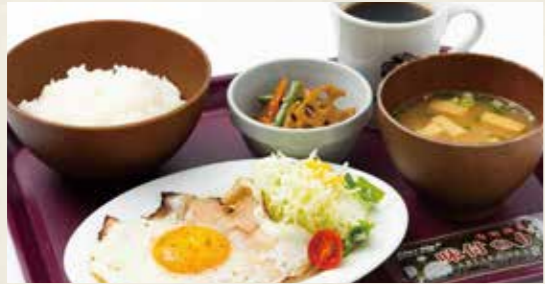
📍ごはんモーニング 900yen ベーコンエッグ・ごはん・お味噌汁・小鉢・海苔・ドリンク (税込 990)

セットドリンクは 391yen (税込 430) の ドリンクメニューからお選び下さい