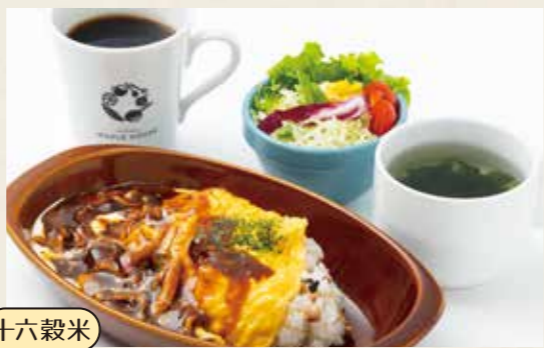
📍日替わりオムランチ 1,000yen 十六穀米オムライス・ミニサラダ・スープ・ドリンク (税込 1,100)