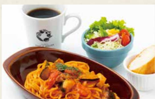
📍週替わりパスタランチ 1,091yen パスタ・ミニサラダ・ミニバゲット・ドリンク (税込 1,200)