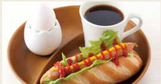
📍ドッグモーニング 618yen ホットドッグ・ゆで卵・ドリンク (税込 680)