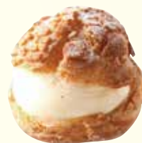
シュークリーム ¥ 330 (税込 363)