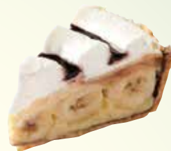
バナナパイ ¥ 540 (税込 594)