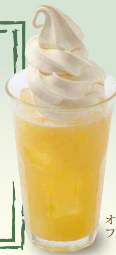
オレンジ フロート