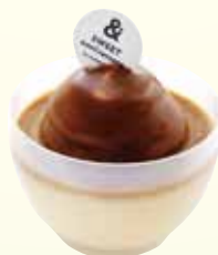
生キャラメルプリン ¥ 450 (税込 495)