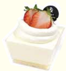
レアチーズケーキ ¥ 520 (税込 572) ※季節によってフルーツが変わります