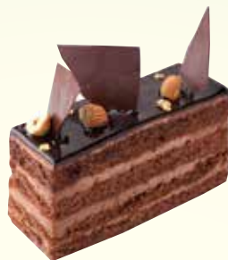
ショコラ ¥ 630 (税込 693)