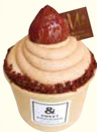
モンブランカップ ¥ 580 (税込 638)