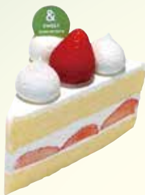
ストロベリーショート ¥ 680 (税込 748)

※ケーキのデザインは異なる場合もございます。詳しくはスタッフに尋ねるか、ショーケースをご覧ください。