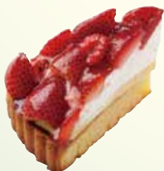
ベリーベリートルト ¥ 630 (税込 693)